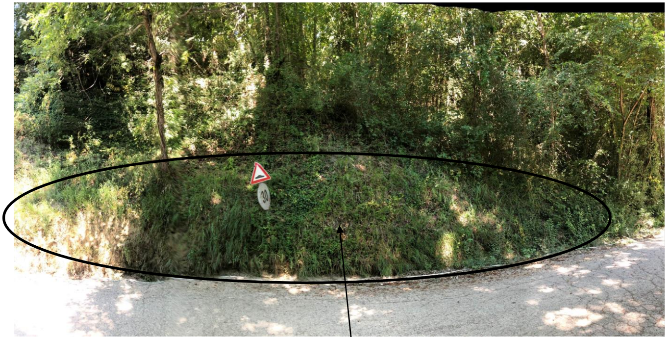
Vista panoramica di fronte; è indicata la zona da contenere.