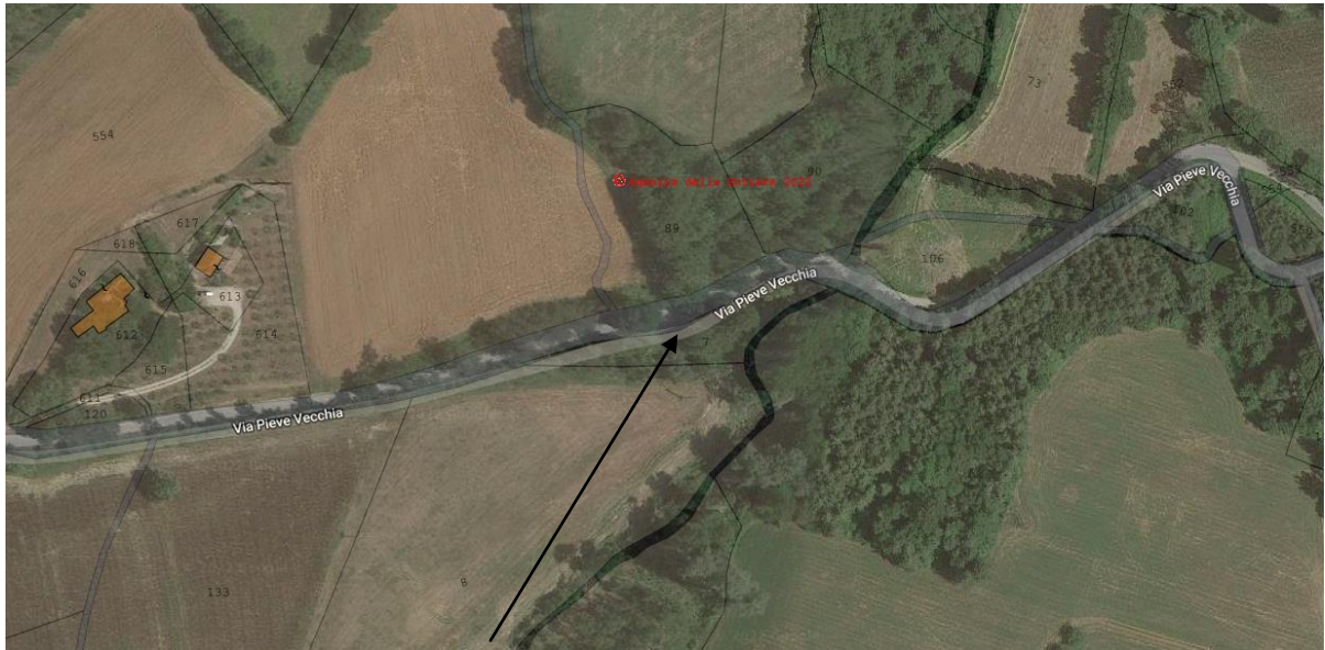
Luogo di intervento