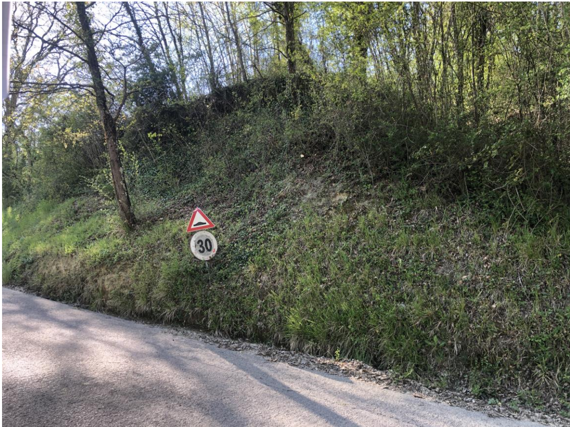
Zona dove realizzare la gabbionata per contenere la scarpata; vista di fronte.