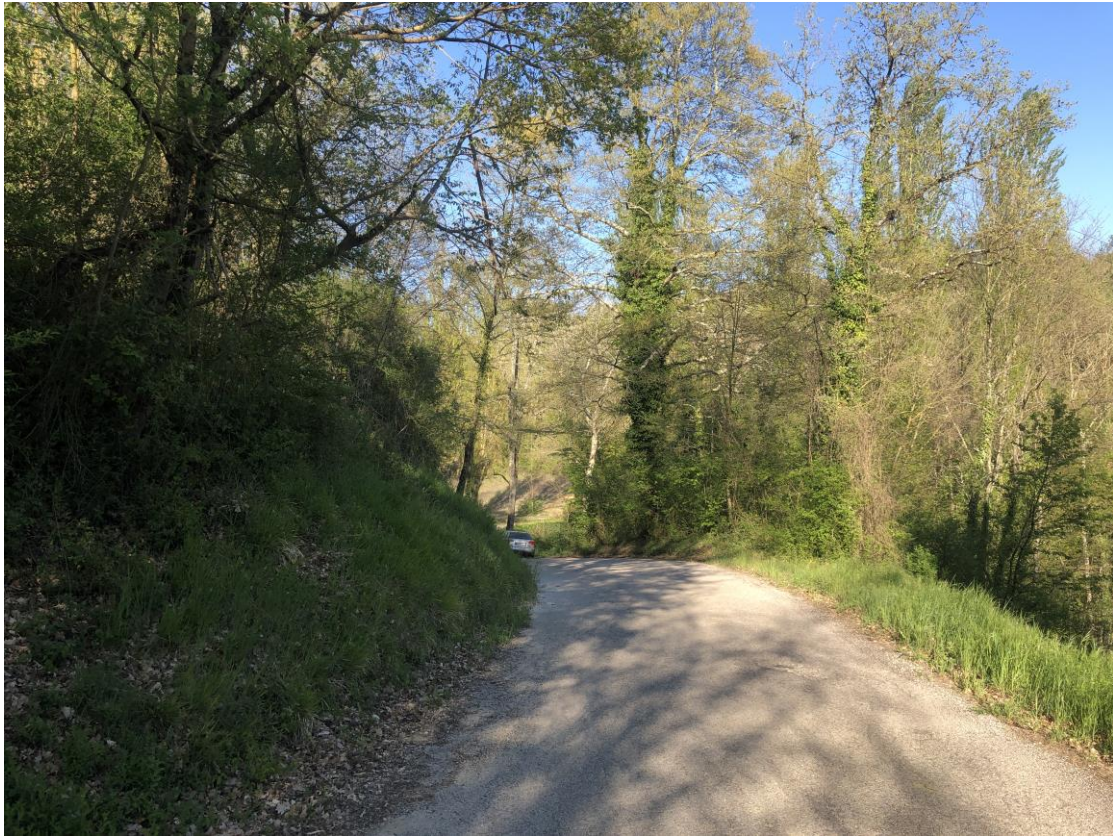
A sx si vede la terra scivolata; a sx si realizzerà la gabbionata, vista da monte.